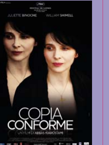
Copia conforme di Abbas Kiarostami, in lingua originale con sottotitoli italiani, in sala Scorsese. Maggiori informazioni sul sito e sui quotidiani.